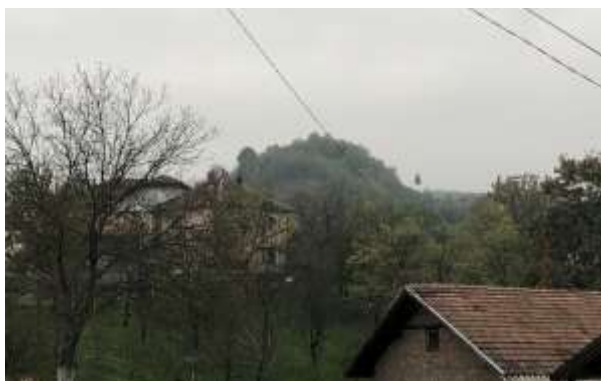
SLIKA – Pogled na lokaciju sa sjevera

visokim stablima i šikarom negativan utjecaj korijenja vegetacije. Vidljivi arheološki ostaci i nalazi nisu konzervirani, mjestimično su oštećeni.