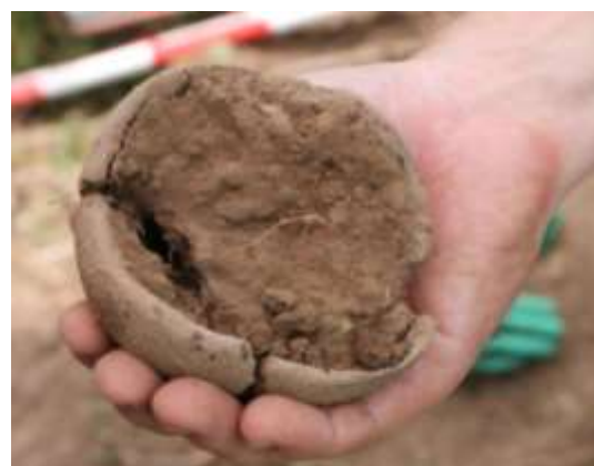
SLIKA – Pronađena bronzanodobna keramička posuda istraživanjem u 2019. godini

Kulturni sloj je bio jako plitak i većina sloja je nestala erozijom, dok je arheološki materijal uništen ili je erozijom dislociran na niže tarase brda Stražba.