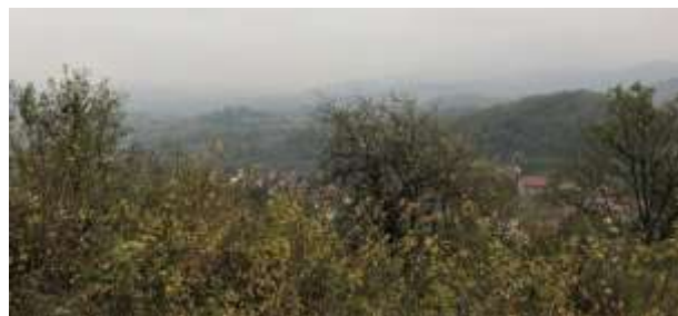
SLIKA – Pogled sa lokacije prema istoku

infrastrukturi i izgradnjom građevina. Lokacije je devastirana i korištenjem dijela lokacije kao poljoprivrednog dobra. Vidljiva su i oštećenja ilegalnim iskopavanjem i vandalizmom. U mnogim okolnim građevinama, u samom dnu, moguće je primjetiti stari obrađeni kamen, za koga mještani tvrde da je uzet sa Stražbe ugrađen u objekte. Očito je da se kroz historiji i prahistoriju objekti na Stražbi korišteni i kao izvor materijala za gradnju okolnih građevina.