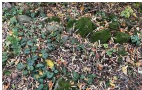
SLIKA – Površinski nalaz temelja/zida građevine

Godine 2018. i 2019. izvršeno je nedestruktivno i nesistematsko površinsko istraživanje u organizaciji muzeja u Tešnju od strane A. Mujkanović i A. Agić. Rekognosciranjem lokaliteta prikupljeni su fragmenti keramike iz kasnog bronzanog doba. Istraživanjem su otkriveni površinski nalazi predhistorijske keramike i tragovi temelja/zidina na lokaciji. Većina pronađenih keramičkih fragmenata koncentrisana je sa sjeverne strane nalazišta.