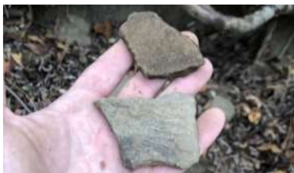
SLIKA – Površinski nalaz keramike na brdu sa sjeverne strane