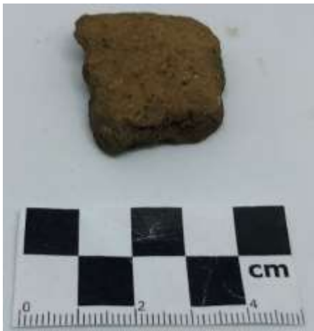
SLIKA – Fragment keramike pronađen prilikom površinskog istraživanja u 2019. godini