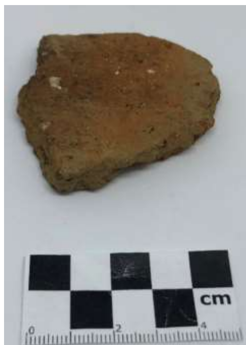
SLIKA – Fragment keramike pronađen prilikom površinskog istraživanja u 2019. godini

Pronađeni fragment keramike su raznih veličina i sa raznih dijelova posuda. Na osnovu velikog broja prikupljenih fragmenata u ovom istraživanju moguće je napraviti rekonstrukciju cjelokupnog keramičkog inventara korištenog u ovom nalazištu kroz bronzano doba i onda ga tipološki uporediti sa inventarom iz susjednih nalazišta. To bi onda dalo jasnu sliku pripadnosti ovog nalazišta i jasno definisanje kojoj kulturnoj grupi ili mješavini kulturnih grupa nalazište pripada. Sav prikupljeni arheološki materijal je očišćen i dokumentovan a nalazi se u depou muzeja u Tešnju.