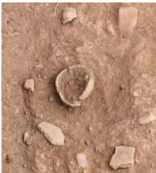
SLIKA – Pronađena bronzanodobna keramička posuda istraživanjem u 2019. godini in situ

Ispod kulturnog sloja je živa stijena koji i čini osnovu brda Stražba i proteže se na sve strane. Postoje naznake da je stijena šuplja i da ispod brda postoje i tuneli.