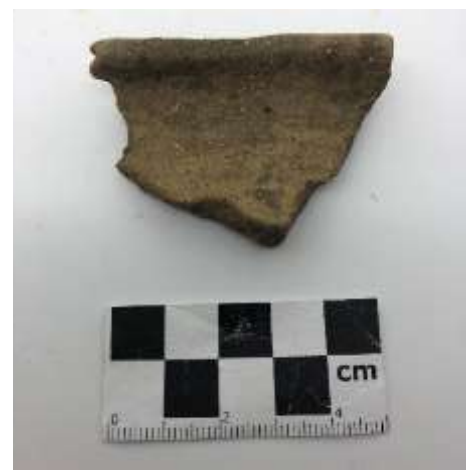
SLIKA – Fragment keramike pronađen istraživanjem u 2019. godini