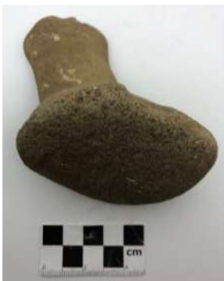
SLIKA – Kamena alatka pronađen prilikom istraživanja u 2019. godini

Godine 2019. detaljnija sondažna istraživanja, u organizaciju Muzeja u Tešnju sprovodi Institut za