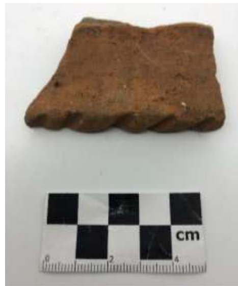
SLIKA – Fragment keramike (rub posude) pronađen istraživanjem u 2019. godini