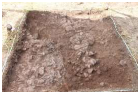
SLIKA - Otvorena sonda na zaravnjenom platou

U svim sondama vrlo brzo smo došli do žive stijene i sterilnog sloja. Na zaravnjenom platou pronađeni su tragovi koji ukazuju na postojanje bronzane radionice za odljevanje bronzanih predmeta. Detaljan izvještaj Instituta za arheologiju u vrijeme pisanja još nije bio dostupan za javnost.