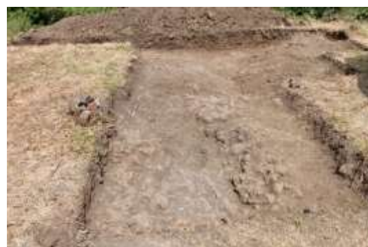
SLIKA - Otvorena sonda na zaravnjenom platou sa tragovima postojanje bronzane radionice