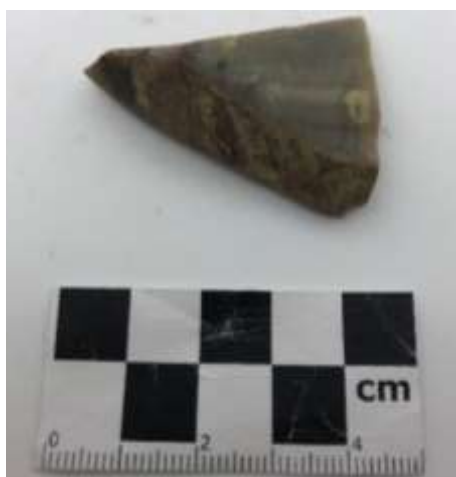
SLIKA – Fragment kamene alatke pronađen prilikom istraživanja u 2019. godini