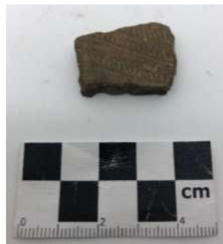
SLIKA – Fragment keramike sa ornamentima pronađen prilikom istraživanja u 2019. godini