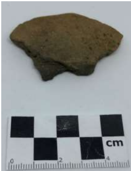
SLIKA – Fragment keramike pronađen prilikom površinskog istraživanja u 2019. godini