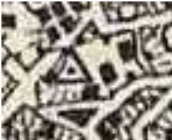
SLIKA – Detalj vrha brda Stražba na karti Mrkotića i okoline iz 1912. godine na kome se vide ucrtanim građevinama – kućama koje je moguće vidjeti i danas (pravougaonici) a vrh brda je označen trokutom sa tačkom u sredini (vrh kote)

vjerovatno sagrađena u vremenu poslije do 1779. godine.