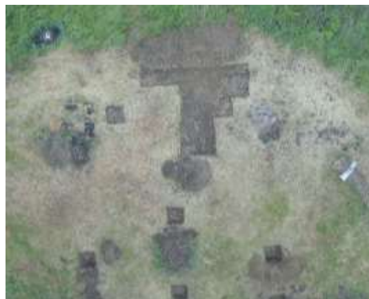
SLIKA – Pogled odozgo na lokaciju i otvorene sonde

arheologiju sa Filozofskog fakulteta u Sarajevu uz vodstvom arheologa E. Bujaka. Najveći dio pronađenog materijala predstavljaju fragmenti keramike čija je većina preliminarno datirana u bronzano doba. Dio nalaza se može svrstati i u antičko doba te srednji vijek. Nalazi potvrđuju kontinuitet boravka čovjeka na našem prostoru i donekle oslikavaju njegove životne i radne navike i aktivnosti. Detaljno je istražen zaravnjeni plato na vrhu brda.