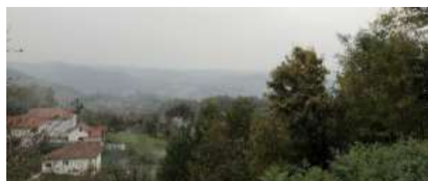
SLIKA – Pogled sa lokacije prema zapadu

Nalazi na lokaciji. Ovo arheološko nalazište kroz historiju je istraživano u više navrata. Stariji stanovnici Mrkotića svjedoče da su Austrougari vršili neka istraživanja oko i na Stražbi. Istraživanja su se nastavila i kasnije posebno nakon popularizacije legende oko Gospine slike, koja po predanju dolazi iz Mrkotića sa Stražbe. Novija istraživanja lokacije je vršio B. Belić godine 1963. Na istom lokalitetu nalaze se ostaci gradinskog naselja iz bronzanog doba po B. Beliću, zatim ostaci građevine koju je on definisao kao ostaci crkve - crkvište i nekropola stećaka, koji su utonuli pod zemlju a danas se uopšte ne primjete.