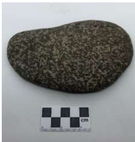
SLIKA – Kamena oštrilica pronađena prilikom površinskog istraživanja u 2019. godini