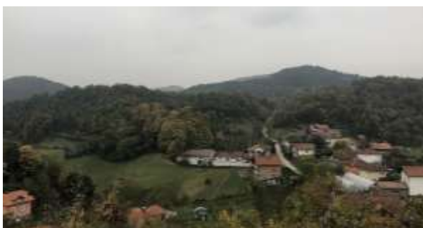
SLIKA – Pogled sa lokacije prema jugu

Arheološko nalazište je ugroženo erozijom tla, zatim utjecajem ljudskog faktora, utjecajem vegetacije i djelimična izloženost nalaza atmosferilijama, zatim neprovođenje zaštite i konzervatorskih zahvata nakon arheološkog iskopavanja. Lokacija je djelimično devastirana građevinskim radovima na