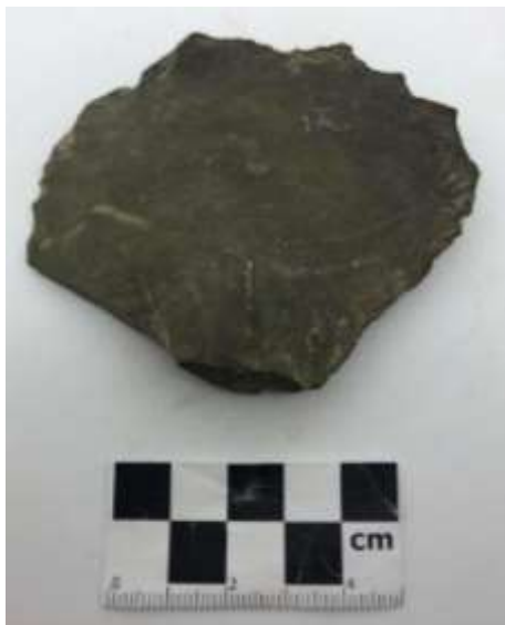
SLIKA – Kamena alatka pronađen prilikom površinskog istraživanja u 2019. godini