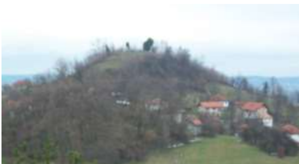
SLIKA – Pogled na lokaciju sa juga