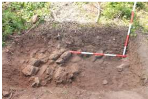
SLIKA - Otvorena sonda na zaravnjenom platou