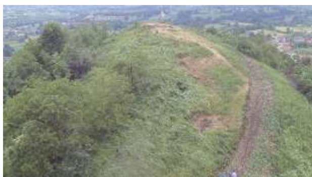
SLIKA – Pogled odozgo na lokaciju sa juga