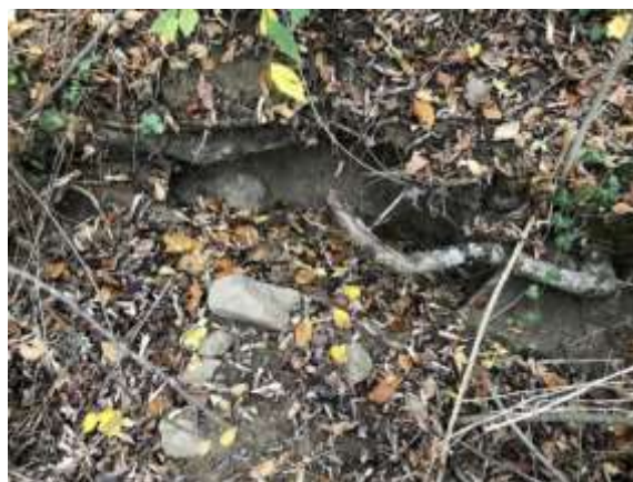
SLIKA – Uzurpirano nalazište od strane kradljivaca u kome je pronađen ostatak keramike

Godine 2018. i 2019. izvršeno je nedestruktivno i nesistematsko površinsko istraživanje u organizaciji muzeja u Tešnju od strane A. Mujkanović i A. Agić. Rekognosciranjem lokaliteta prikupljeni su fragmenti keramike iz kasnog bronzanog doba. Istraživanjem su otkriveni površinski nalazi predhistorijske keramike i tragovi temelja/zidina na lokaciji. Većina pronađenih keramičkih fragmenata koncentrisana je sa sjeverne strane nalazišta.