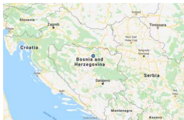
SLIKA – Položaj općine Tešanj u sjevernoj Bosni

dinarskog područja, odnosno jadranskog zaleđa i istočne obale Jadranskog mora. Doline pritoka Bosne, Usora i Spreča, bile su važni migracioni pravci, kao i rijeka Ukrina koja povezuje ovaj teritorij sa rijekom Savom i dalje na sjever. Novija istraživanja su pokazala da se elementi kontinuiteta i homogenosti fenomena materijalne kulture češće nalaze kod zajednica koje su smještene u izoliranijim prostorima ili prostorima koji se ponovo naseljavaju, odnosno rekoloniziraju.