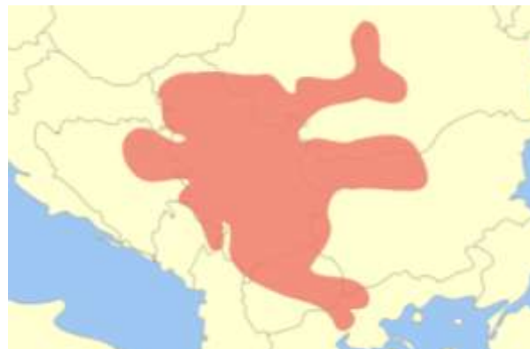
SLIKA – Rasprostanjenost Vinčanske kulture

oblast Vinčanske kulture obuhvata prostor centralnog Balkana, a u trenutku kada je dostizala vrhunac podudarala se sa teritorijom koju je u mlađem i srednjem neolitu obuhvatala starčevačka kultura.