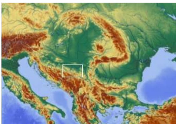
SLIKA – Položaj sjeverne Bosne u Centralnoeuropskom panonskom bazenu

Uvodni dio. Područje općine Tešanj, kao i njena šira okolina, sjeverna Bosna, ima izuzetno bogatu prošlost doseljavanja i življenja. Tragove svog kretanja i zadržavanja na ovome prostoru ostavili su još paleolitski lovci i sakupljači, iz roda homo, čak i dosta prije dolaska Homo sapijensa, naših direktnih predaka u Europu. Sjeverna Bosna se geografski nalazi u okviru centralnoeuropskog panonskog bazena i to na njegovoj južnoj granici. Centralnoeuropski panonski bazen zatvoren je planinskim lancima Karpata, Dinarida i Alpa, osim na mjestima gdje najveća europska rijeka Dunav ulazi, tj. izlazi iz bazena. Sjeverna Bosna je geografska regija ograničena planinskim lancem Dinarida sa juga, rijekom Drinom sa istoka, rijekom Savom sa sjevera i rijekom Unom sa zapada.