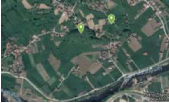
SLIKA – Mapa lokacije prikazana pomoću Google maps