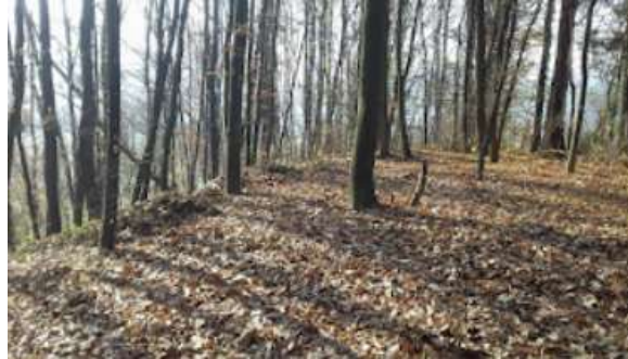
Pogled sa lokacije prema zapadu

Nalazi na lokaciji. 1961. godine. istraživanje vršio A. Benac i njegovog tima, a nakon njih i B. Belić. Uz njen južni i istočni rub brda otkriveni tragovi neolitskog naselja – kreneni odbici, kameni odbici i oklesivanje oblikovane sjekire, motike, uz rijetke fragmente keramike. Pri oranju razoreni objekti građeni od pečenog lijepa sa pljevom i otiscima drvene armature.