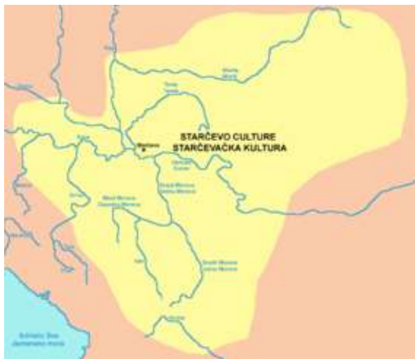
SLIKA – Rasprostanjenost Starčevačke kulture

lokaliteta jugoistočne Europe. Ovo mješanje slojeva i artefakata dodatno otežava kreiranje osnove stratigrafske analize arheološkog lokaliteta. Oko 7.000. godine p. n. e. nastaje tzv. „klimatski optimum“, tokom koga se tope ledničke mase u Europi, pojas četinarskih šuma se pomjera ka sjeveru. Klima se menja, postaje topla i vlažna što je pogodovalo listopadnim šumama koje se šire u jugoistočnoj Europi. Ostaci flore i faune sadrže kosti sisara, ptica, riba, ljušturu puževa.