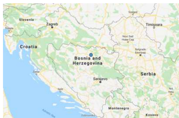
SLIKA – Položaj općine Tešanj u sjevernoj Bosni

podunavskog prostora na sjeveru, te unutrašnjosti dinarskog područja, odnosno jadranskog zaleđa i istočne obale Jadranskog mora. Doline pritoka Bosne, Usora i Spreča, bile su važni migracioni pravci, kao i rijeka Ukrina koja povezuje ovaj teritorij sa rijekom Savom i dalje na sjever. Novija istraživanja su pokazala da se elementi kontinuiteta i homogenosti fenomena materijalne kulture češće nalaze kod zajednica koje su smještene u izoliranijim prostorima ili prostorima koji se ponovo naseljavaju, odnosno rekoloniziraju.