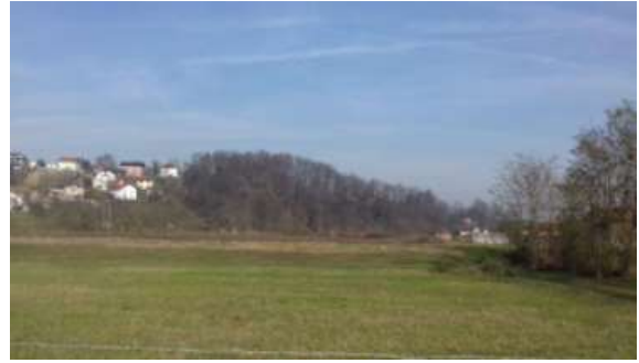
SLIKA – Pogled na lokaciju sa juga