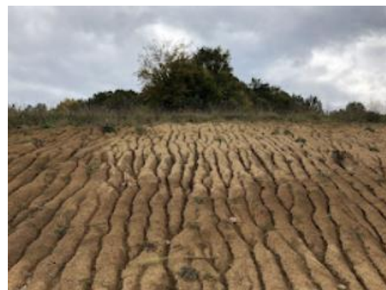
SLIKA – Pogled na dio lokacije oštećen ljudskim djelovanjem

Na donjoj strani ispod ploha nalazi se izbočina (bulbus) na kojoj je vidljiva jedna veća i tri manje otprsrline. Ovo je gotov proizvod jer se na oba ruba vidi retuš. Lijevi rub sječiva obrađen je retušem u gornjoj zoni dok je desni rub retuširan cijelom dužinom. Primjetan je oštar ugao između ploha i obrade na gornjoj strani proksimalnog ruba. Sječivo je definisano kao musterijansko ručno sječivo iz srednjeg paleolita 2 .