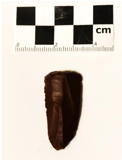
SLIKA – Artefakt pronađen na površini oranice