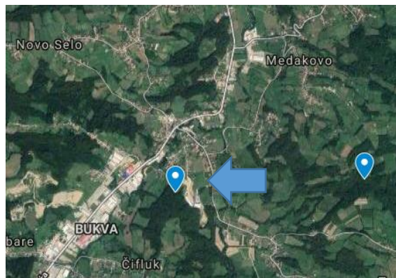
SLIKA – Mapa lokacije prikazana pomoću Google maps

Nalazi na lokaciji. Artefakt na slici ispod je pronađen na površini na zapadnom dijelu lokacije. Dužina mu je 39,2 mm a širina 18 mm. Ako je dužina odbojka barem dvostruko veća od širine, a rubovi su manje-više uporedivi onda ga nazivamo sječivom 1 ili šiljkom. Na artefaktu su