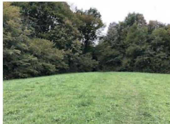
SLIKA – Pogled na lokaciju sa sjevera

jasno definisane gornja (dorzalna) i donja (ventralna) strana. Na gornjoj strani na distalnom rubu nalazi se obradba pa je artefakt moguće definisati kao alat. Preko cijele površine gornje strane promjetan je greben koji ide sredinom sječiva.