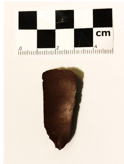
SLIKA – Artefakt pronađen na površini oranice

Zaključak. Ova lokacija je jako zanimljiva za daljnja istraživanja posebno zbog toga jer je novootkrivena i prije nije istraživana. Nalaz musterijskog ručnog sječiva upućuje na period srednjeg paleolita kada je ova lokacija bila korištena.