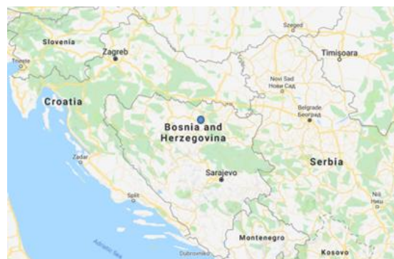
SLIKA – Položaj općine Tešanj u sjevernoj Bosni

Rijeka Bosna je od najstarije prošlosti važna prirodna komunikacija između panonsko-podunavskog prostora na sjeveru, te unutrašnjosti dinarskog područja, odnosno jadranskog zaleđa i istočne obale Jadranskog mora. Doline pritoka Bosne, Usora i Spreča, bile su važni migracioni pravci, kao i rijeka Ukrina koja povezuje ovaj teritorij sa rijekom Savom i dalje na sjever. Novija istraživanja su pokazala da se elementi kontinuiteta i homogenosti fenomena materijalne kulture češće nalaze kod zajednica koje su smještene u izoliranim prostorima ili prostorima koji se ponovo naseljavaju, odnosno rekoloniziraju.