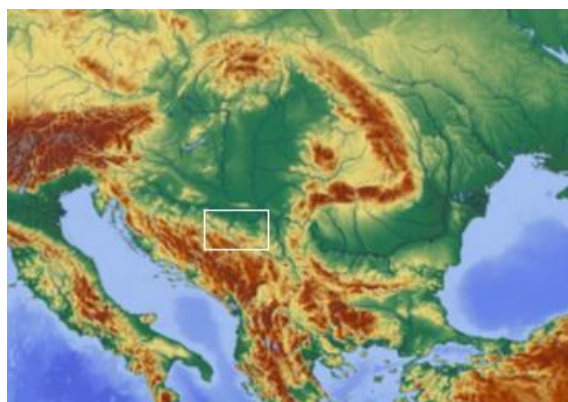
SLIKA – Položaj sjeverne Bosne u Centralnoeuropskom panonskom bazenu

Uvodni dio. Područje općine Tešanj, kao i njena šira okolina, sjeverna Bosna, ima izuzetno bogatu prošlost doseljavanja i življenja. Tragove svog kretanja i zadržavanja na ovome prostoru ostavili su još paleolitski lovci i sakupljači, iz roda homo, čak i dosta prije dolaska Homo sapijensa, naših direktnih predaka u Europu. Sjeverna Bosna se geografski nalazi u okviru centralnoeuropskog panonskog bazena i to na njegovoj južnoj granici. Centralnoeuropski panonski bazen zatvoren je planinskim lancima Karpata, Dinarida i Alpa, osim na mjestima gdje najveća europska rijeka Dunav ulazi, tj. izlazi iz bazena. Sjeverna Bosna je geografska regija ograničena planinskim lancem Dinarida sa juga, rijekom Drinom sa istoka, rijekom Savom sa sjevera i rijekom Unom sa zapada.